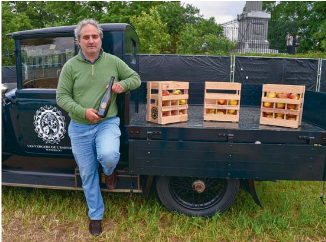
La bouteille a remporté un prix en Italie pour son design.

Mais ce n'est pas seulement la localisation qui permet de rattachier le jus de pomme à 1815. « Nous travaillons avec des arbres en demi-tige ou en haute-tige, comme à l'époque », précise le propriétaire des lieux. L'effet direct de cette technique est un rendement plus faible. « Nous avons fait 5.000 bou-